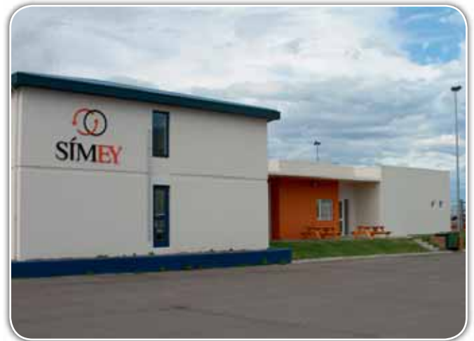
Húsnæði SÍMEY að Þórsstíg 4 Akureyri.

SÍMEY er með samstarfssamning við Fjölmenn, full-